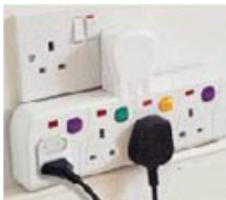
Esto del multiplicador nos suena de algo, ¿verdad?

✦ La misma tecnología de corrientes portadoras (PLC) con su propio protocolo usa DeltaDore en su nuevo sistema para la gestión de la calefacción eléctrica . Además el sistema es compatible con los teletandos por radio Tyxia, Tydom y los elementos de seguridad Tyxal que permite la sustitución de interruptores tradicionales por automatismos para persianas y otras funciones.